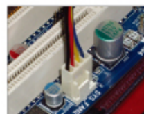
マザーボードへの接続