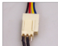
3ピン→4ピン変換コネクタ